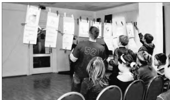
Buchpräsentation mit der „Wäscheleine“.