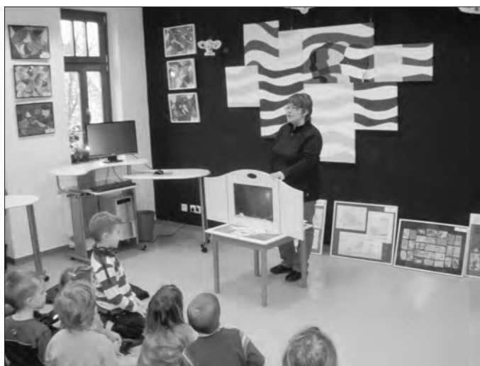
Kamishibai Erzähltheater im Lesepoint mit Vorschulkindern der Kita „Haus Sonnenschein“.