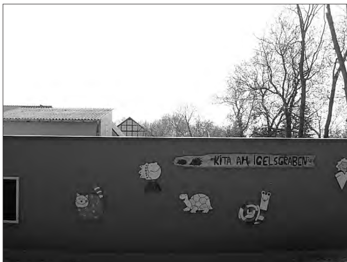
Maltafeln an der Wand des Spielplatzes

Ebenso wurden am 18.04.2011 durch Frau Schmidt vom Kinderfreundlichen Landkreis zwei riesige Maltafeln an die Kinder des Kindergartens „Am Igelgraben“ übergeben, die auch gleich an der Wand des neu gestalteten Spielplatzes ihren Platz fanden.