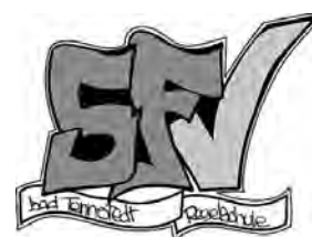
Förderverein der staatlichen Regelschule Bad Tennstedt "Regelschule" e.V.