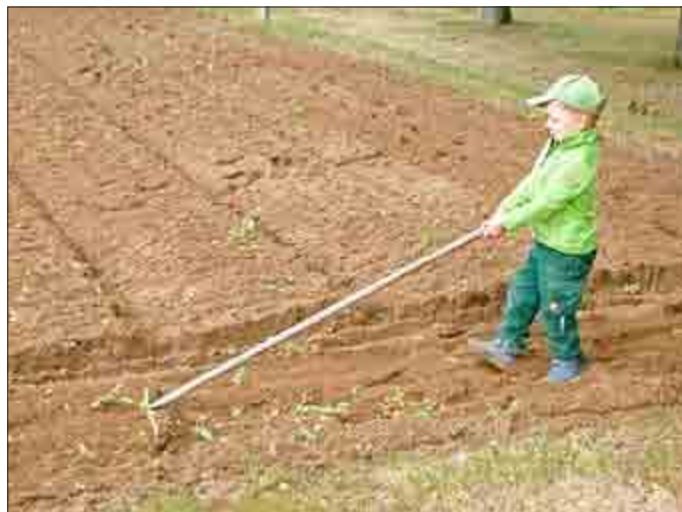
Auch der Jüngste zeigte enormen Einsatz