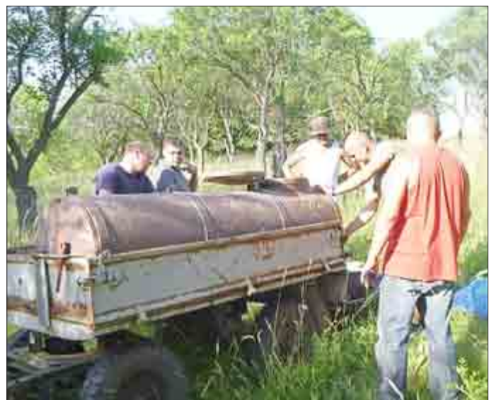
„Stau“ am Wasserfass